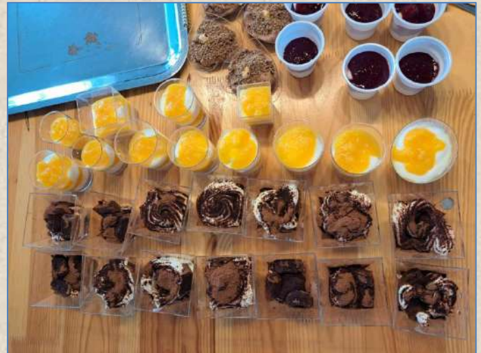
Članice Aktiva kmečkih žena Budna vas