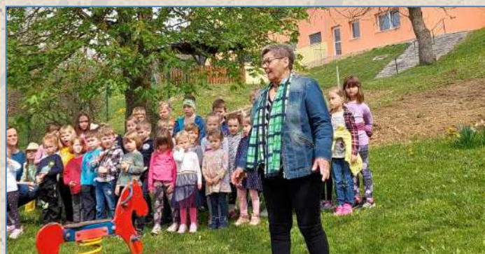
Učenci šolskega novinarstva, OŠ MM, Šentjanž