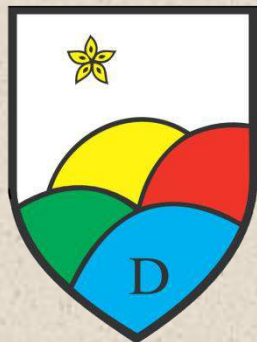
Krajevna skupnost Šentjanž