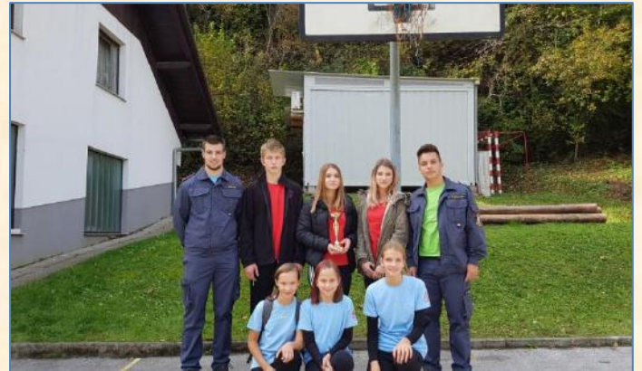
Z gasilskim pozdravom »Na pomoč!«

Vsem sodelujočim se iskreno zahvaljujem za sodelovanje in čestitam za odlične rezultate.