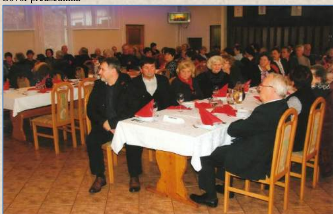
Jubilanti in gostje