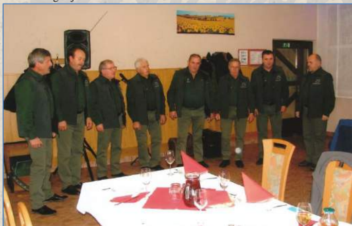
Pevci so popestrili praznovanje.