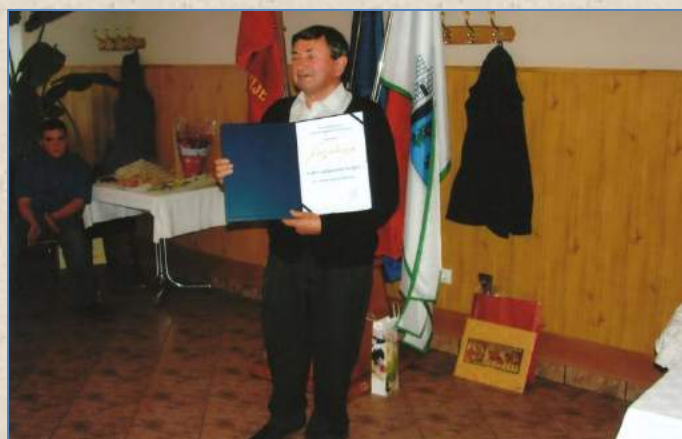
Priznanje društvu za dolgoletno aktivno in uspešno delo