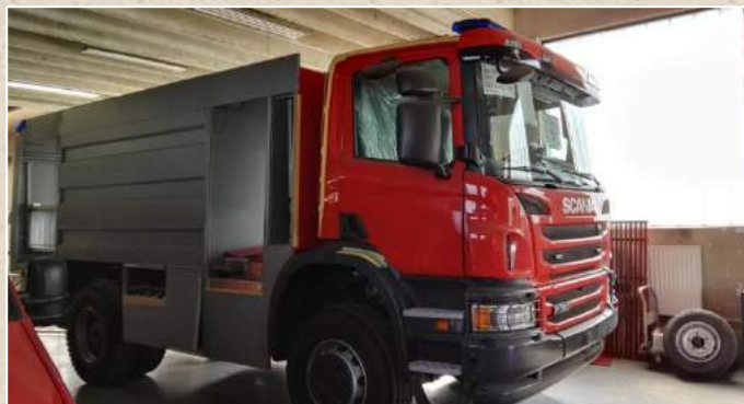
Opločevinjenje gasilskega vozila

Prostovoljno gasilsko društvo Šentjanž deluje že 109 let, kar pomeni, da naslednje leto praznujemo že 110-letnico delovanja. To je častljiva obletnica in obletnica vredna praznovanja. Vsa minula leta so nam dala modrosti in voljo do poslanstva, ki ga opravljamo. Srečo imamo, da je intervencij sorazmerno malo. Da je temu res tako, sem pregledal intervencije zadnjih desetih let in sem ugotovil, da jih je v povprečju le med 5 in 6 na leto. Zelo pomemben podatek pa je, da smo bili v vseh intervencijah pravočasni in uspešni. Poleg tega pa smo v 19 letih prepeljali preko tri milijone litrov pitne vode, s katero smo oskrbeli vsakogar v bližnji in daljni okolici, ki je to dobroto potreboval in je izrazil željo. Velikokrat smo bili deležni kritik v zvezi s predragim prevozom vode, mi pa smo se zavedali, da je cena več kot polovico manjša od uradnega cenika GZ Slovenije. To dejstvo se premalokrat poudari oziroma javno pove, saj nam tega ne dovoljuje naša skromnost, prostovoljnost ter predanost poslanstvu. Malce krivde prevzamem nase, a kljub temu lahko zatrdim, da delamo dobro, preudarno in okoljsčinam primerno.